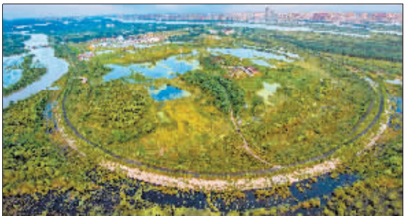
哈尔滨太阳岛西区外滩湿地公园。汪金铭 摄(资料片)

多年来,哈尔滨坚定不移地贯彻“绿水青山就是金山银山”发展理念,坚持节约优先、保护优先、自然恢复为主,扎实推进生态文明建设和生态环境保护工作,带来生态环境显著改善,19.87万公顷各类湿地释放出强大的“环境改善力”,为建设“绿色龙江”,打造“宜居幸福之都”提供强大生态助力。