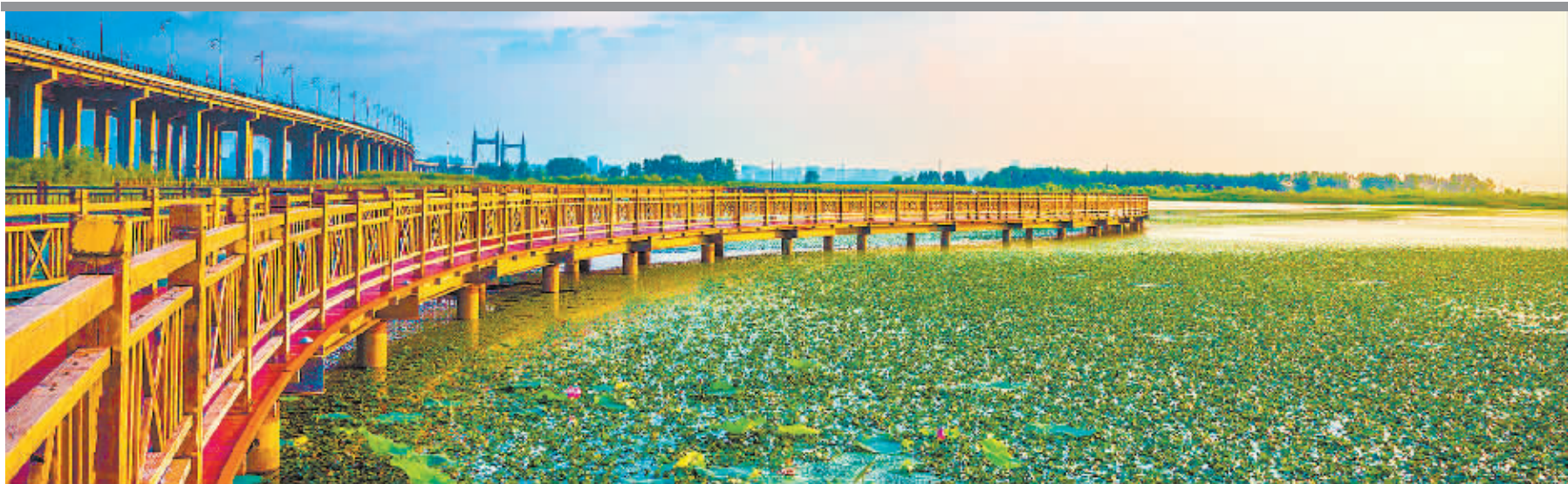
晨曦中的阳明滩湿地绿意葱茏,风景如画。