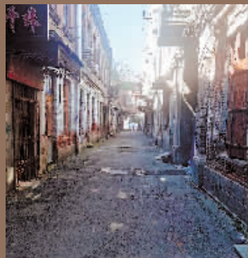
如今的松光电影院胡同。