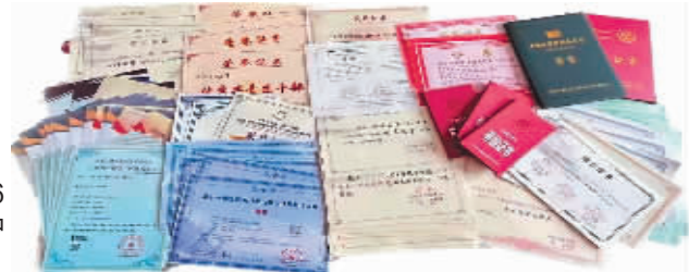
寝室6人的各种荣誉证书。