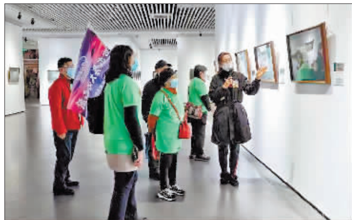
市民走进哈尔滨美术馆,参观画展。

除了油画,馆内还展出各种金石篆刻和雕塑艺术品,名家之作在方寸之间尽显功底,吸引参观者驻足细细品味。集合时间到了,还有参观者在画作前恋恋不舍,大家纷纷表示希望这样有意义的活动能够多举行,“这不仅仅是参观画展,也是上了一堂艺术课,受益匪浅!”