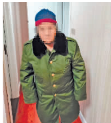
居民家中老人身穿军大衣。