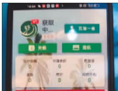
市民手机App里的数据被清零。