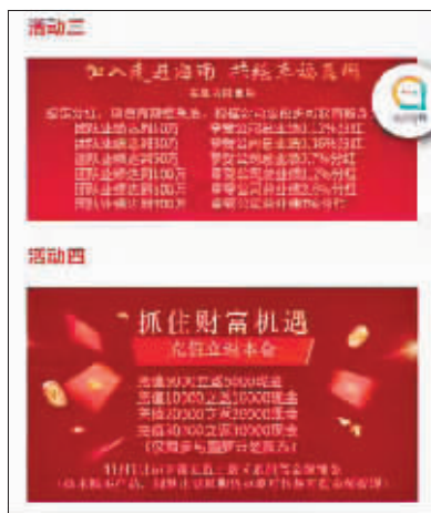
该App上的部分“投资”活动。