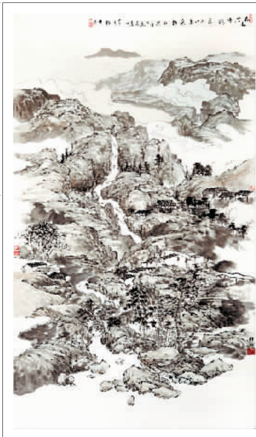
《担当》 38cm × 53cm