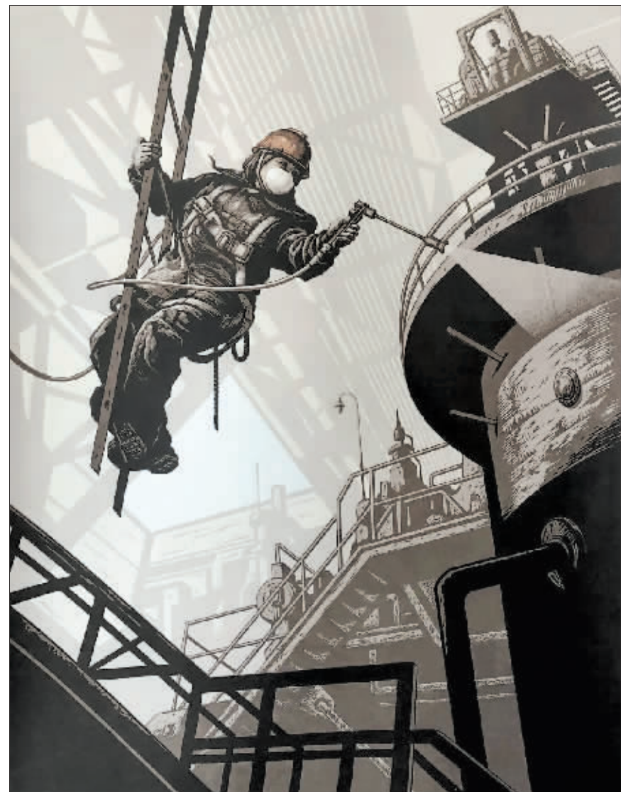
《凌空翔舞》 108cm × 83cm