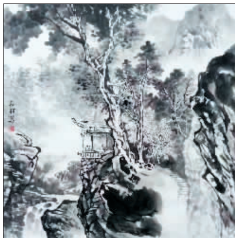
国画《空山新雨》作者 孙羽