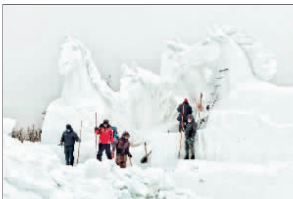
摄影《雪马中的人》作者 老兵帅克