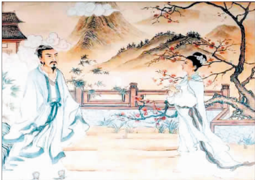
杜牧初见歌女张好好时，对她倾慕不已。

比起江西，扬州交通方便，贸易发达，商贾云集，是个相当繁华的地方，茶楼酒肆以及一些娱乐场所更是少不了。“落魄江湖载酒行，楚腰纤细掌中轻。十年一觉扬州梦，赢得青楼薄幸名。”在这里，杜牧爱玩的特性发挥得淋漓尽致：每天忙完公务，等到入夜，他就换上便装外出，各处歌舞场所都留下了杜大人的身影，有时候甚至闹到宿醉不归。