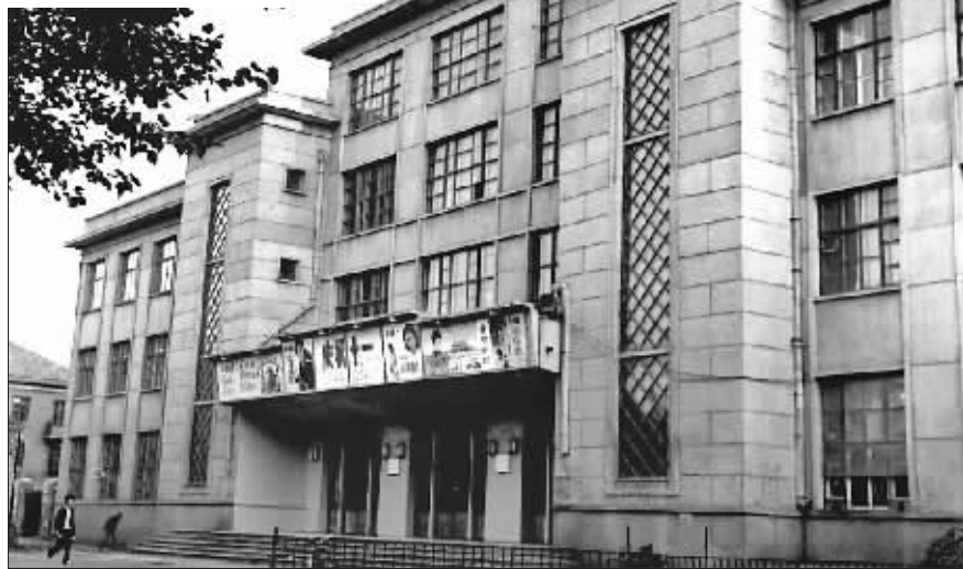
▲哈一机文化宫整体外观。

哈尔滨第一机器制造厂(简称“哈一机”)原来的小俱乐部是在1955年由单身职工食堂改建而成的,坐落在宏图路与武原街交口处。剧场面积2000平方米,有930个座席。当时,该俱乐部经常放映电影、组织文艺演出等活动。随着工厂的发展,小俱乐部已不能满足需要,哈一机于1975年4月1日开始易地选址修建哈一机文化宫。