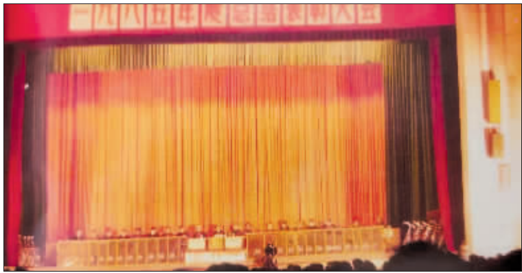
大会会场。▲20世纪80年代总结表彰