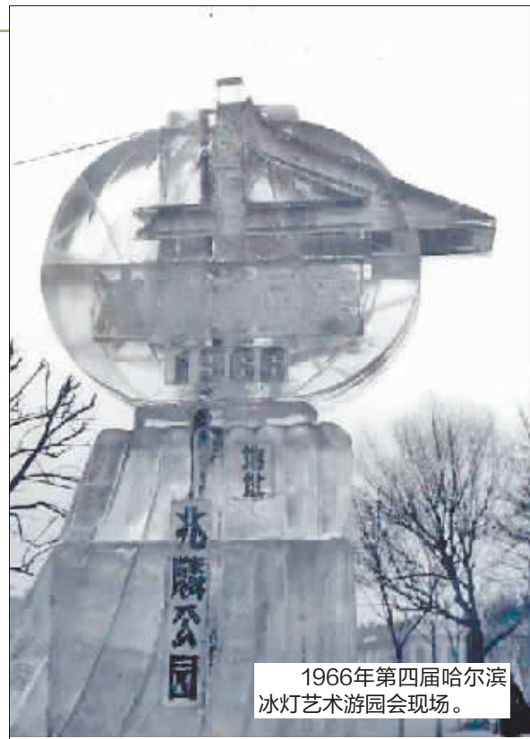
1966年第四届哈尔滨冰灯艺术游园会现场。