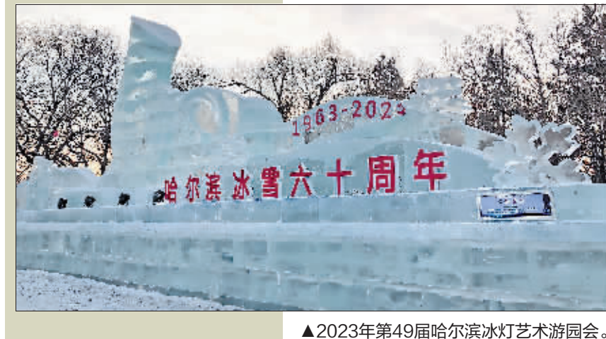
▲2023年第49届哈尔滨冰灯艺术游园会。