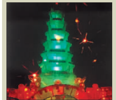
▲20世纪八九十年代的冰建筑 and 雪雕。