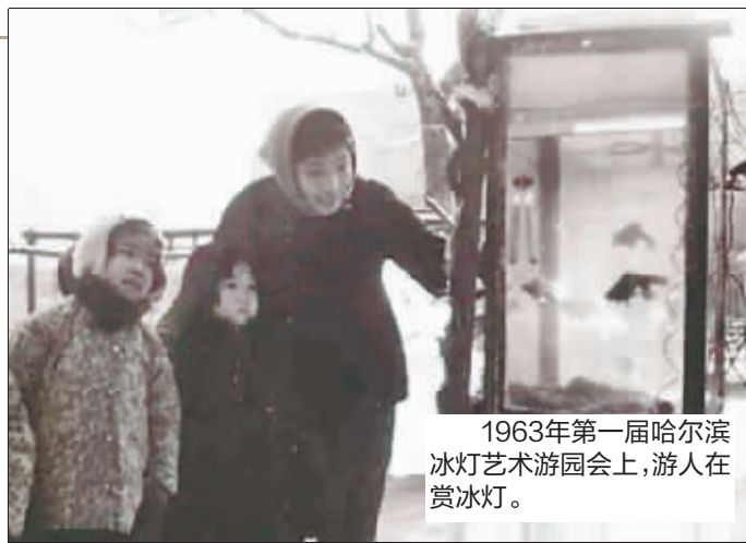
1963年第一届哈尔滨冰灯艺术游园会上,游人在赏冰灯。

哈尔滨冰灯艺术游园会自1963年创办,历经半个多世纪的风雪磨砺,2023年迎来她的六十冰雪华诞。60年前在兆麟公园举办的首届冰灯展,让“猫冬”的哈尔滨人走出了家门,在为期六天的冰灯展中,25万哈尔滨市民来到这里赏灯玩雪,哈尔滨的冰雪文化由此拉开帷幕。现如今,兆麟公园的冰雕、太阳岛的雪雕、哈尔滨冰雪大世界,已成网红打卡地。