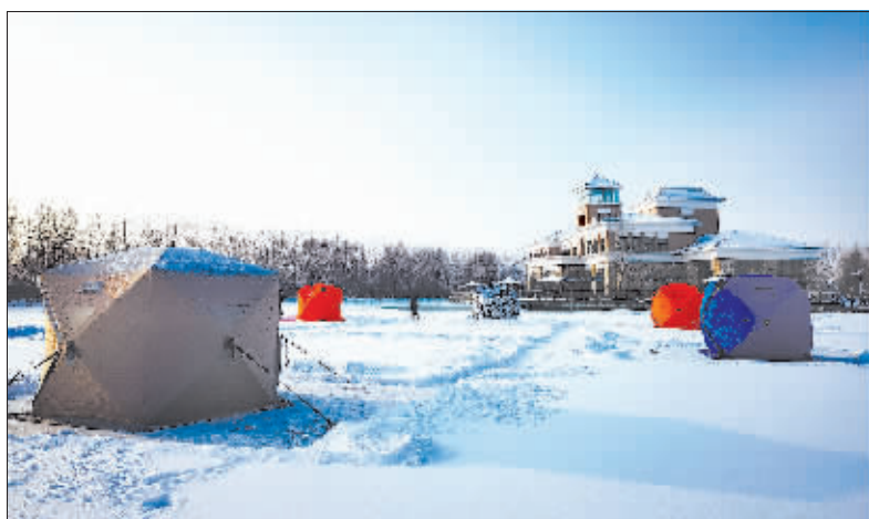
保温帐篷不惧严寒。