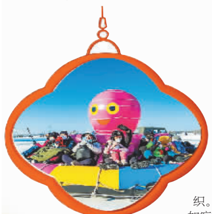
新晚报制图 宋占晨