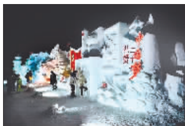
冰雪文化红色品牌科技创新作品《礼赞二十大·建设新森工》。