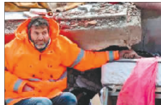
一名土耳其父亲在废墟里紧紧抓着死去女儿的手久久不肯离去。