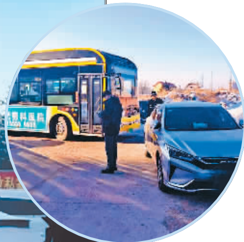
路边停满车辆,道路狭窄,公交车转弯被卡。