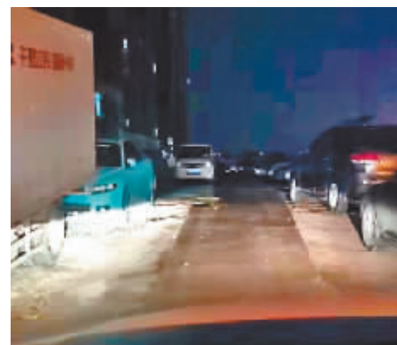
晚上,道路两侧停满私家车,公交车通行变得更加不便。