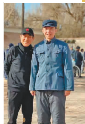
宋家腾与张艺谋合影。