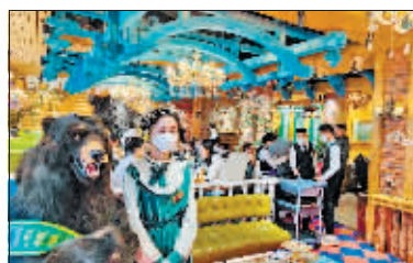
米德维奇座无虚席。