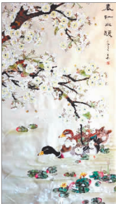
国画《春江水暖》 作者 于丹