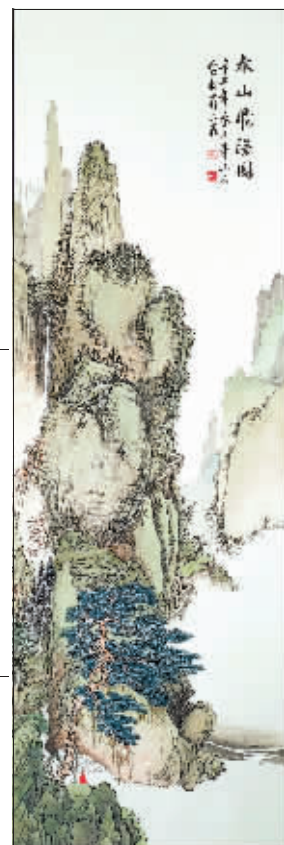
国画《春山飞瀑图》 作者 蒋三在