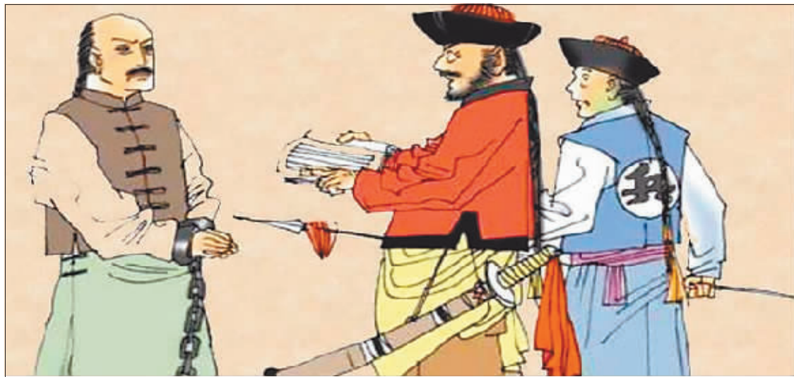
清朝官员在被抄家后,一般会被杀头或流放。

排在第二位的是贪腐亏空的,这是打击贪腐形成的模板,其中最典型的是给皇帝打理私人财务和提供生活服务的内务府。作为皇家的财务,服务皇室成员的日常生活,这巨大开销不能只出不进呀,所以,但凡涉及钱财的生意和政务如盐政、织造、海关等,皇帝都会让内务府的人前去插手承管或监督。但问题是,这个全天下最大的肥缺机构,谁不想从里面捞点油水,把皇家的钱存入自己口袋?它本身就是最腐败的地方:采买上做假账、收受贿赂、与官员交往、巴结或分红,天长日久的,积累的就是一大笔亏空。等皇帝发现时,对他们进