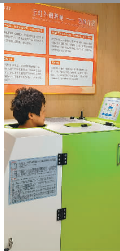
小区居民在进行身体检测。

其中,“积分兑换”主要是鼓励有能力、有精力的老人,在经过中心培训后,通过协助社区或中心探视其他高龄老人,帮他们护理、助洗,或是上门陪