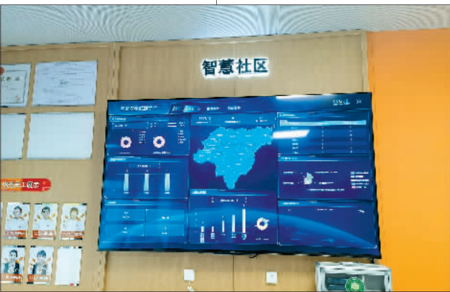
“智慧”居家养老照护中心与小区居民家的终端设备相联,实现“一键呼叫”上门服务。