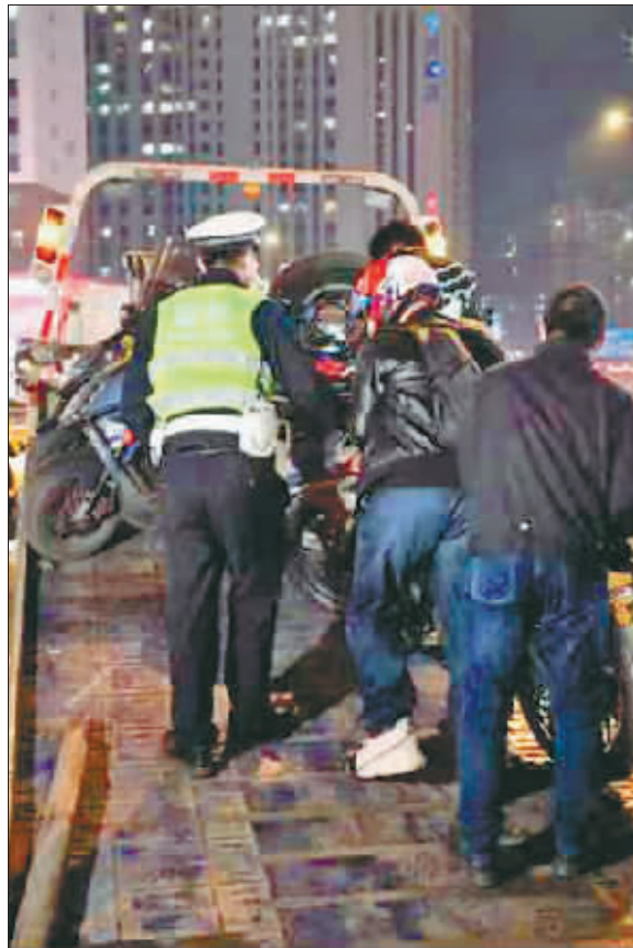
交警部门扣留违法车辆。

经过前期分析研判,4月2日晚,交警部门组织警力对哈西商圈和谐大道、万达广场周边“炸街”摩托车、改装车违法行为开展集中查处。当晚,黑A8943*、吉AEP06*、黑L5402*、黑B4755*、黑L5791*等多台“炸街”摩托车及驾驶人被取缔。这些车辆驾驶人涉嫌无证驾驶、非法改装拼装、驶入禁行区域等多项违法行为。目前,交警部门将违法车辆扣留,案件正在进一步处理中。