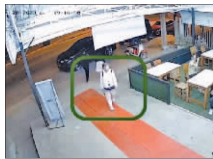
女留学生3月28日前往一家百货公司后失踪。

泰国媒体披露，3名犯罪嫌疑人计划在死者3月初进入泰国上学时，引诱死者爱上其中一名犯罪嫌疑人。3月29日上午，死者父亲曾收到来自犯罪嫌疑人的勒索