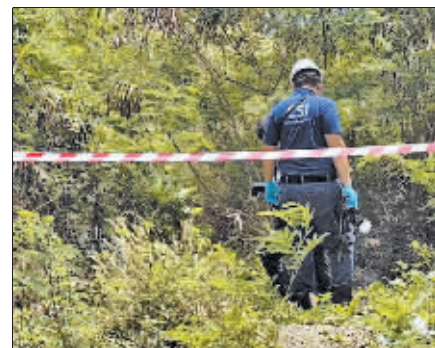
尸体在一片香蕉林被发现。

信息，要求其将50万元人民币(约合250万泰铢)转入一个中国账户。由于不确定女儿的具体情况，其父亲没有在第一时间转账。