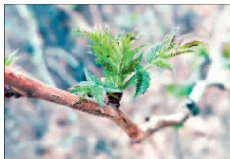
摄影《一抹春绿》作者 陶滨