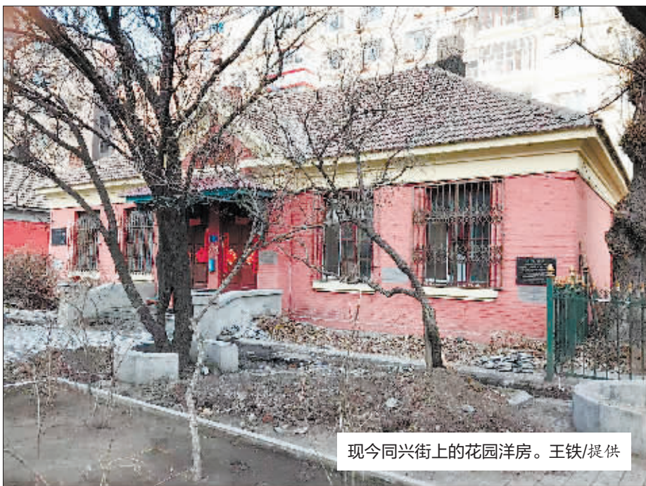
现今同兴街上的花园洋房。

20世纪50年代初,同兴街9号、13号和15号的住户都是俄侨,他们独门独院。虽然与周围人家不太来往,但也熟悉彼此的生活。夏季傍晚,他们喜欢在院子里用平锅烙水果馅的馅饼;主食是牛奶和列巴,喜食洋葱和西红柿等蔬菜。那时夏季的黄昏,小街炊烟袅袅,弥漫着一股异国风情。1958年他们陆续离开哈尔滨,有的回国,有的去了澳洲。