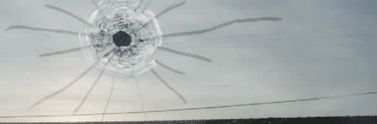
在美国亚拉巴马州戴德维尔枪击事件现场拍摄的弹孔。

美国亚拉巴马州东部小镇戴德维尔15日晚一场生日聚会发生枪击,至少4人死亡,28人受伤。美国总统拜登16日说,美国社会枪支暴力日益增多“令人震惊、不可接受”,呼吁国会制定严格的控枪法律。然而,美国专家和媒体普遍对联邦层面的控枪立法前景感到悲观。