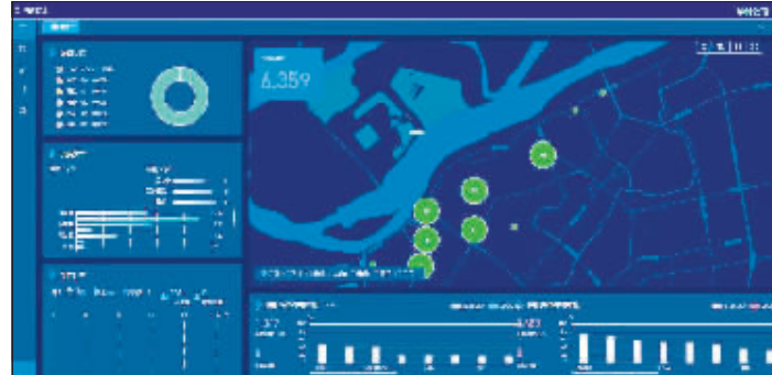
“智慧供热”系统可实时监控各区域的供热情况。

控手段,造成供热质量不好。此外,典型热用户室温采集数据覆盖率较低,不能及时反馈出室温的实时信息,导致不足以对热力站的调控起到很好的支持作用。因此,建设一套新的智慧供热系统将大幅提高调控效率,可以快速有效发现室温薄弱区域。