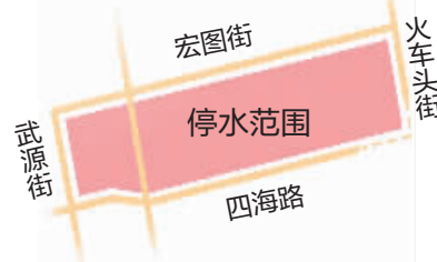
新晚报制图/田宇阳

本报讯(记者 王丹)记者从哈尔滨供水集团获悉,因供水管线改造工程施工,需对南直路直径600毫米、直径400毫米供水管线停水,拟定于5月5日24时至5月6日24时,北起宏图街、南至四海路、西起武源街、东至火车头街围城区域内部分用户停水,南直路(一机路至东直路)周边区域水压降低。停水期间,广大用户储备好日常用水,预计会提前恢复供水,请关闭好水龙头。