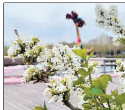
风雨过后,丁香花悄然绽放。