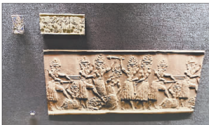
恩赫杜安娜的滚筒私印描摹了她史诗中景象。