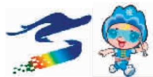
大赛会徽和吉祥物

大赛各竞赛项目分别设置金、银、铜和优胜奖,对获得金、银、铜牌的职工身份选手,可按照有关规定授予“龙江技术能手”称号。对各竞赛项目获得前三名,且留省就业的选手(团队),分别给予2万元、1万元和