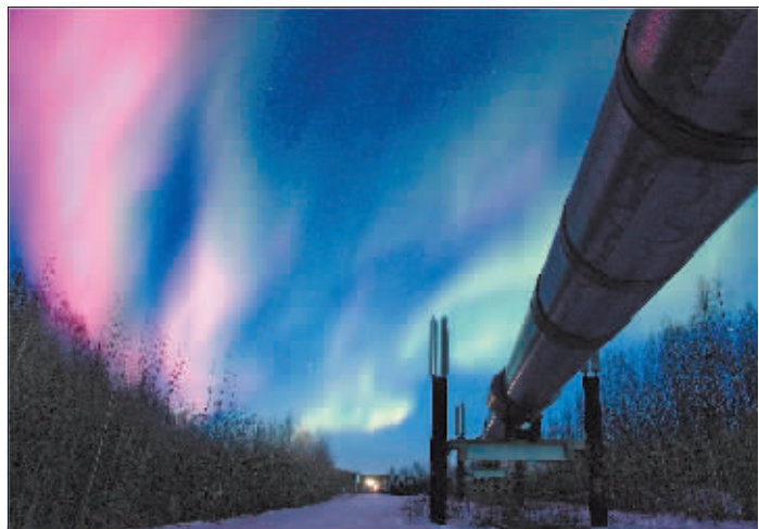
红色极光下的阿拉斯加输油管道。