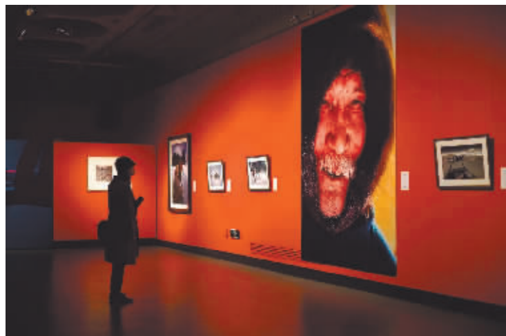
展览中一幅巨幅肖像作品令人震撼。