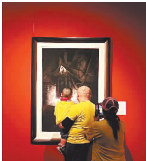
一家人沉浸在摄影作品中。

许多参加活动的市民表示，此次“哈尔滨文化之旅”让他们意犹未尽，收获很多，提升了修养，增长了知识，希望下次还能有机会参加。