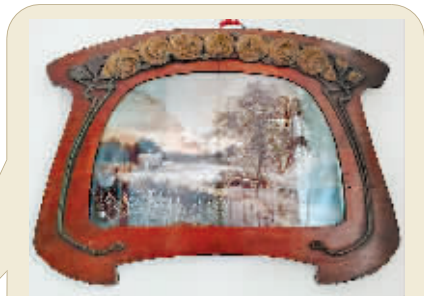
▲俄侨房主留下的水彩画。