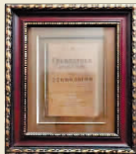
◀镶嵌在镜框里的旧俄文课本。