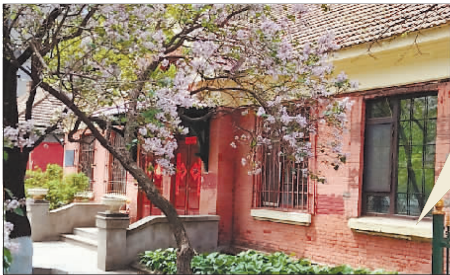
▲丁香花盛开时节的洋房。

哈尔滨俄侨遗物较多,其中不乏一些艺术精品,彰显出欧洲灿烂的历史文化。当年俄侨中不少都是贵族或知识分子,对艺术品十分青睐,很多人家里都保存水彩画、油画和其他工艺品。许多年后,在我结交的朋友中,有很多俄侨后裔,到他们家里做客时,