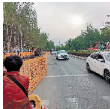
人车混流,暗藏安全隐患。