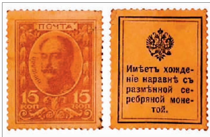
与辅币等值流通的「玛勒卡」。