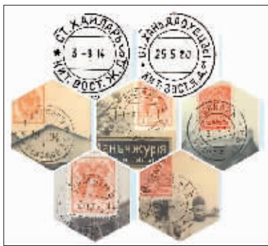
部分中东铁路开办邮政业务的车站邮戳。

人们若是提起邮票的用途，几乎都会异口同声地说出“邮寄信件”四个字。众所周知，邮票是供寄递邮件贴用的邮资凭证。然而，很少有人知道，百余年前，曾有一种邮票作为辅币，在中东铁路的枢纽城市哈尔滨及中东铁路沿线附属地内流通使用过。那时哈尔滨邮政业被沙俄所把持，为沙俄的战争和侵略服务。