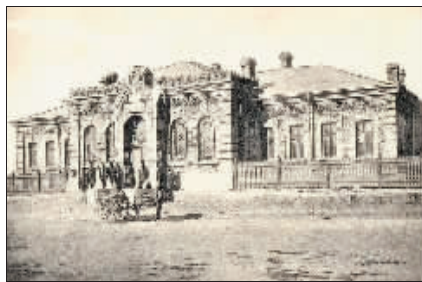
▲当年的哈尔滨战地邮局。

铁路沿线城镇的行政、军警、司法、内河航运和教育等特权。除此之外，沙俄政府凭借中东铁路公司特权继续放手攫取各地邮政权，开设邮政业务，全面加速对这一区域的政治控制及文化渗透。