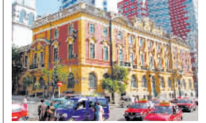
▲吉黑邮务管理局大楼现状。

国人开设的邮局一律接收，由中国邮局取而代之，并在哈尔滨南岗区开设了“吉黑邮务管理局”（现民益街100号，黑龙江省邮电博物馆址），俄国人开设的邮局先后关闭。从此，中东铁路沿线地区的邮政大权回到中国政府手中。“玛勒卡”也终止了使用，永远地退出了历史舞台。哈尔滨的邮政权连同邮政业务回归国有后，成立了中国邮局，哈尔滨邮政开启了新的一页。（本文图片由作者提供）