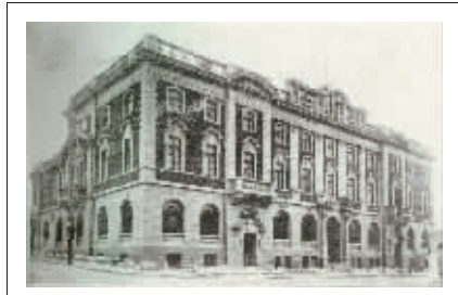
▲1922年5月建成的吉黑邮务管理局。

1920年俄国人的治外法权等被废除。1921年1月滨江道尹出示布告，紧急关闭了设在哈尔滨及中东铁路沿线的俄国邮局。也就是在这一年，中国政府加入了万国邮会，交通部于2月28日收回了邮政权，将哈尔滨及中东铁路界内由俄