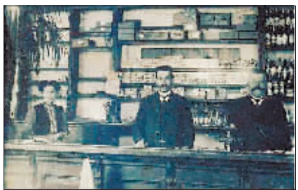
▲当年中东铁路沿线车站小卖部。

由于中东铁路的兴建，沙俄政府利用中东铁路横行霸道，不断扩大对我国东北政治、经济、军事、文化和教育的侵略，完全控制了哈尔滨、满洲里、海拉尔等中