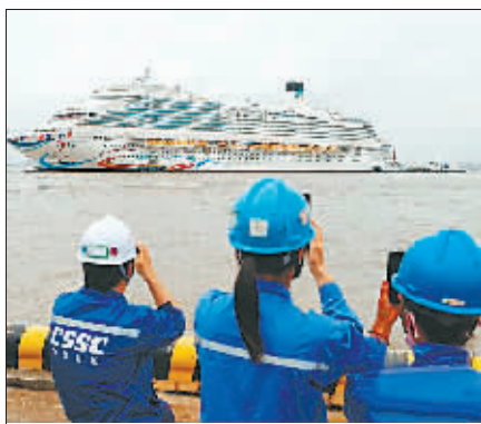
工作人员拍摄“爱达·魔都号”出坞。