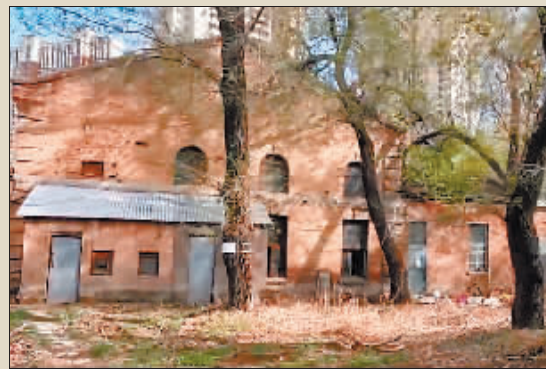
▼哈尔滨无线广播电台发射场现状。

1926年10月1日，哈尔滨无线广播电台正式开播，由于发射设备简陋，收听设备（收音机）普及率比较低，最初社会影响不大。但毕竟是中国城市无线电广播的发端，在中国广播史上确立了应有的地位。