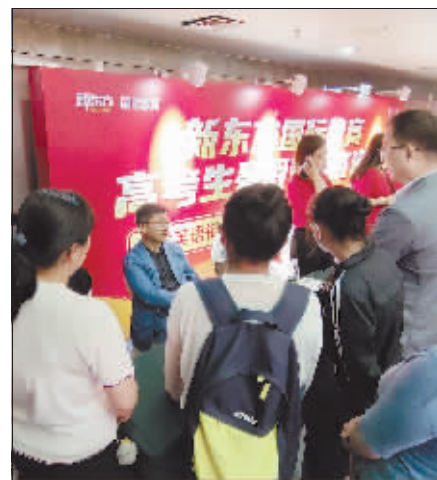
为考生和家长答疑解惑。

针对大一新生或未来有留学打算的学生,新东方国际教育在暑期推出了多款精品雅思课程,提升英语能力、增加留学机会、提高未来就业竞争力。考生和家长们表示不虚此行,并感谢新晚报组织这样的公益活动。