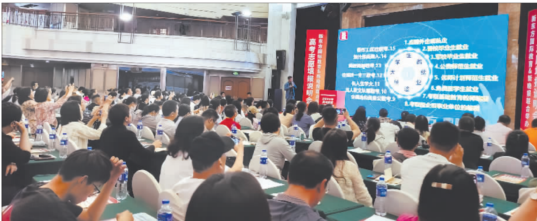
“2023高考志愿填报公益指导会”活动现场。