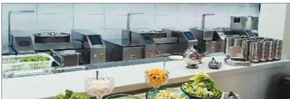
机器人能炒几百道菜品。

闻屡见不鲜。那么，在哈尔滨市服务业中，智能机器人的成本与人工相比是否具有优势呢？