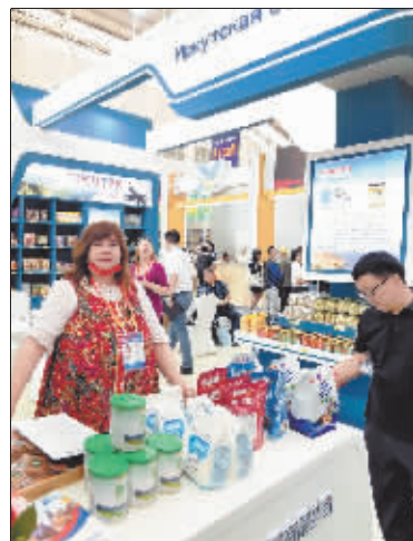
俄罗斯展台地域特色浓郁。