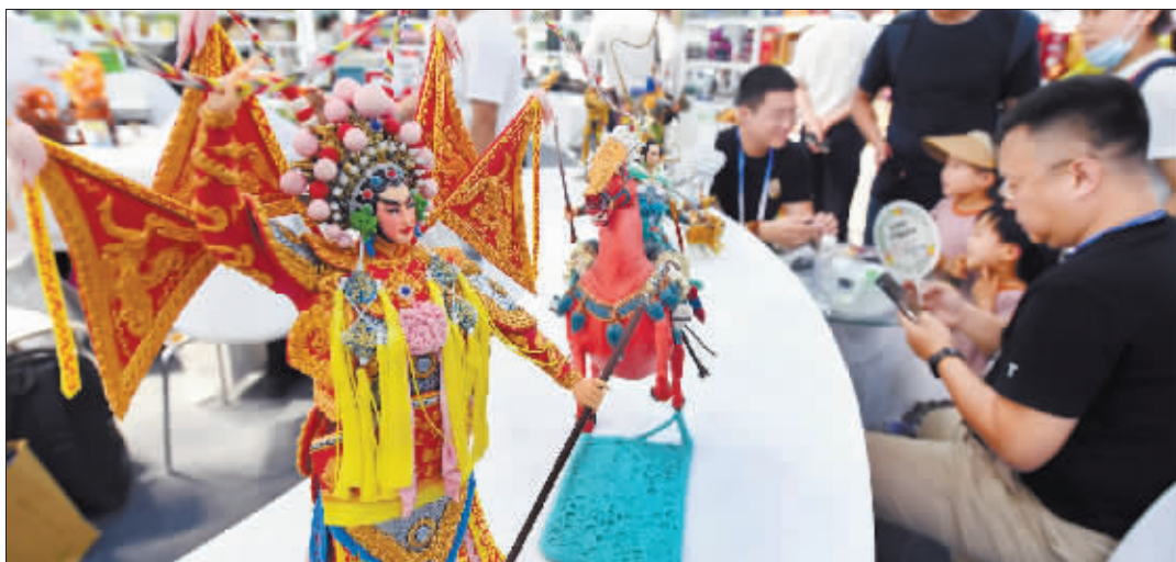
民族文化展示是展会的一大亮点。