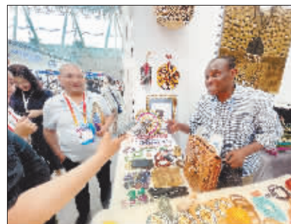
来自世界各地的展商虽然语言不通,但交流无障碍。