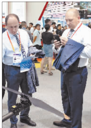
高科技展品引来国外展商的高度关注。