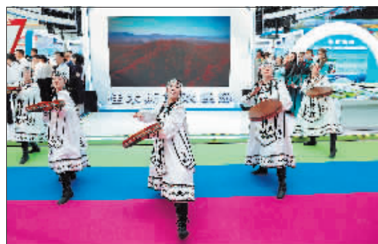
龙江展区的民族文化展示别具特色。