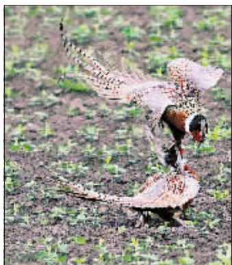
摄影《鸾凤齐鸣》 作者 吕孔信