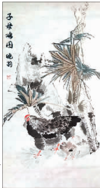
国画《子母鸡图》作者 张晓莉