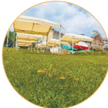
亚布力阳光度假村