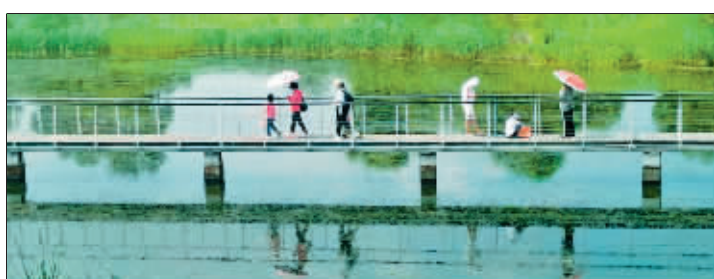
市民在大美湿地尽享清凉。

今日入伏，最高气温27℃。本周哈市还有雨，在14日至16日，气温先升后降。降雨期间容易伴随8到10级对流性大风、小时雨强20毫米到30毫米的短时强降水以及雷电、冰雹等强对流天气。本周气温波动较大，10日至13日气温回升，其中哈市13日最高气温可达29℃到31℃，南部局地达32℃。14日至16日受降水影响，气温持续下降，其中15日至16日哈市白天最高气温将降至21℃到24℃。