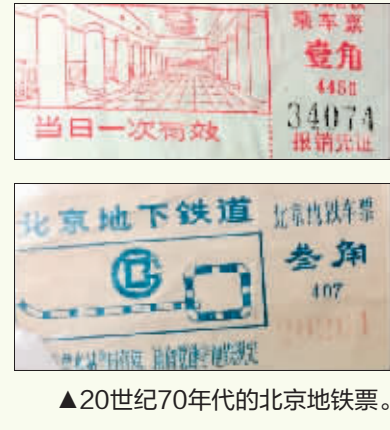
▲20世纪70年代的北京地铁票。