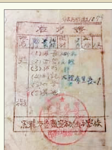
▲作者考高中时的准考证。