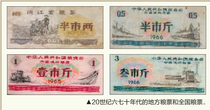
▲20世纪六七十年代的地方粮票和全国粮票。