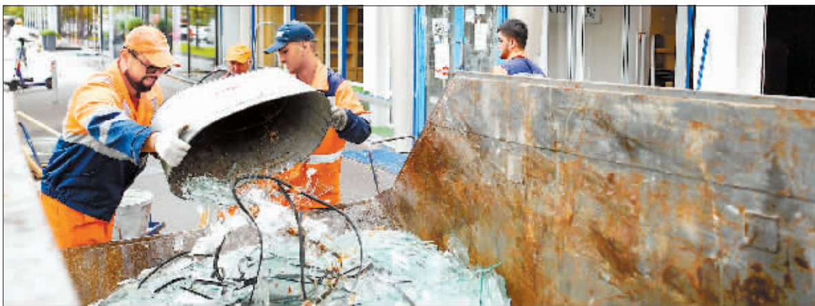
24日，莫斯科工作人员在遭乌克兰无人机袭击的建筑现场进行清理工作。

俄罗斯国防部24日说，乌克兰当天出动17架无人机对克里米亚半岛的设施发动袭击，但袭击未遂。国际原子能机构总干事格罗西24日说，该机构专家日前在对扎波罗热核电站巡查中发现了地雷。