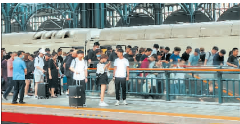
来哈旅游专列数量创新高。