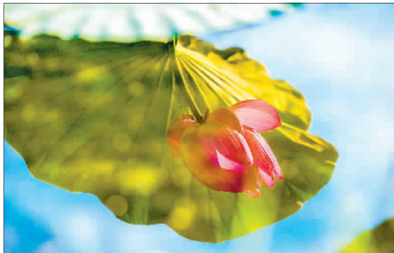
摄影《水中花》 作者 门奎