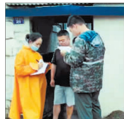
对涉险区域进行排查。