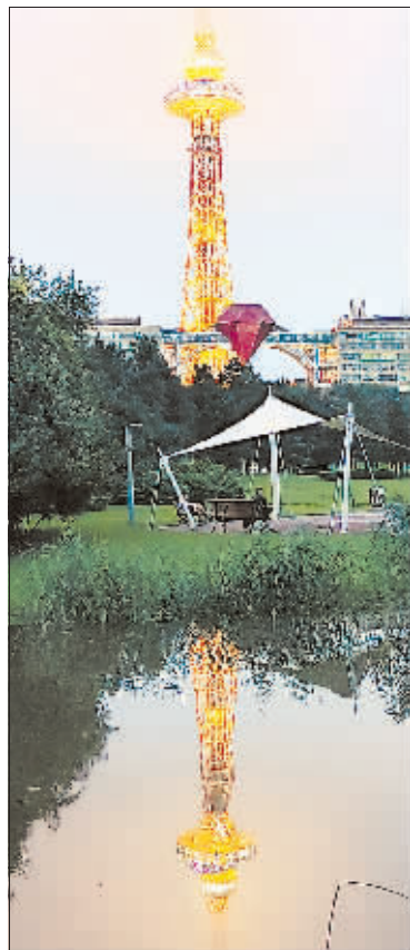
摄影《公园夜色》 作者 薛晓军