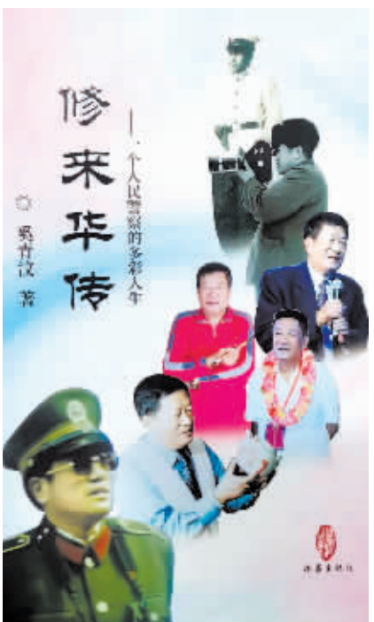
《修来华传——一个人民警察的多彩人生》图书封面。