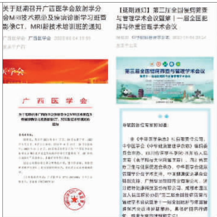
部分医药领域学术会议的举办方发布相关学术会议延期的公告。

2022年11月,市场监管总局曾指出,随着对商业贿赂案件查处力度不断加大,一些医药企业采取更为隐蔽、复杂的手段,为其贿赂行为披上“合法外衣”。而